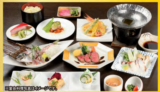
※宴会料理写真は必ず一砂です。